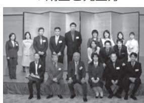
11期生以降と先生方