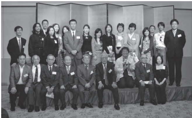
25周年記念総会で最大勢力の3期生と先生方

本同窓会は今年三月に三〇期生を迎えました。つまり同窓会として創立三〇周年になりました。創立十周年以降、五年ごとに記念総会を開催してまいりましたが、来る十一月二六日(土)に東京都立武蔵野北高等学校同窓会創立三〇周年記念総会を開催いたします。