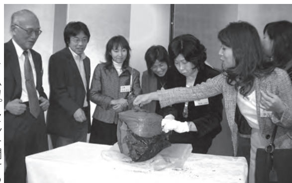
タイムカプセルを開ける 初見先生と二期生