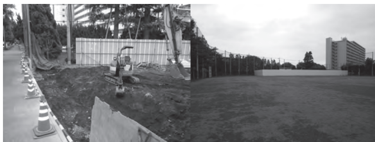
汚染除去作業現場：グラウンド北端部分を掘り返す重機

大規模改修中の部活動には相当な苦労があったと思われるが、それがさらに長引くことになってしまいました。後輩たちには困難に負けずに頑張ってもらいたいものです。